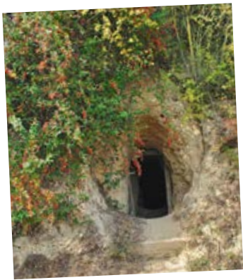
LÖSSHÖHLE OBERHALB VON EICHSTETTEN

übrig ist. Jiddische und hebräische Ausdrücke finden sich nämlich auch heute noch vereinzelt in der Eichstetter Mundart.